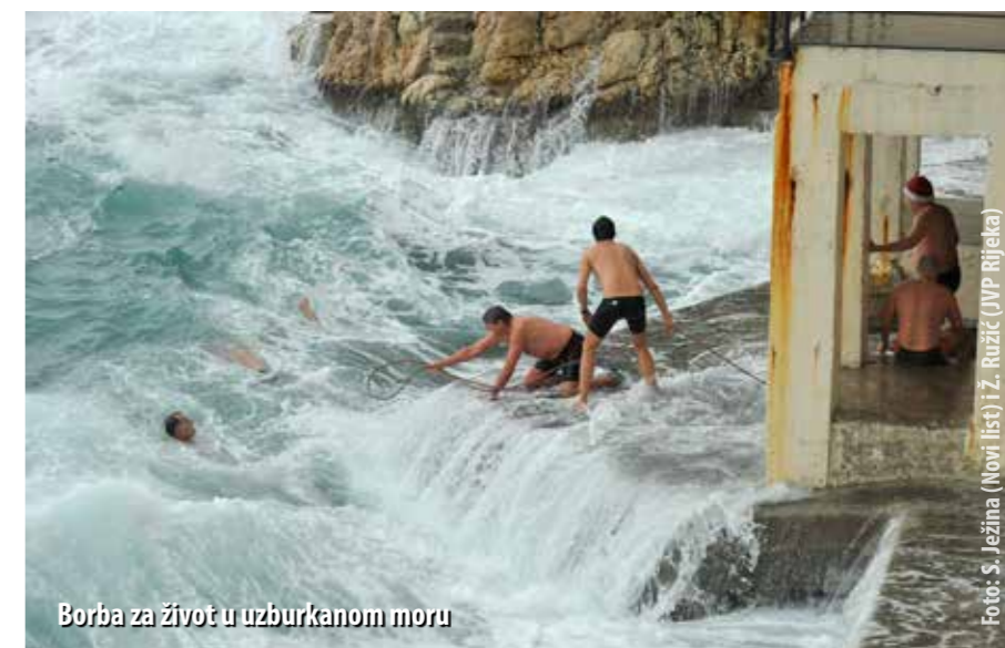
Borba za život u uzburkanom moru

Po dolasku na mjesto intervencije vatrogasce je dočekala prilično konfuzna situacija. -Ja sam se odmah spustio do-