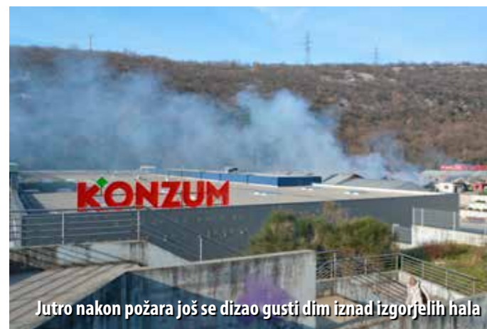
Jutro nakon požara još se dizao gusti dim iznad izgorjelih hala

Riječki vatrogasci, čak i oni stariji, ne pamte tako velik požar zatvorenog prostora kakav se dogodio 16. veljače. Tog petka, u večernjim satima, točnije u 21.18 h, JVP Grada Rijeke zaprimio je dojavu o velikom požaru poslovnoga kompleksa u riječkome naselju Škurinje. Požar je izbio u skladišnim halama tvrtke Elgrad u kojima su se nalazile velike količine suhe drvene građe, iverice, radni strojevi te drugi zapaljivi materijali. Posebnu prijetnju predstavljale su boce s plinom koje su se nalazile u skladištima i koje su, uslijed velikoga požara i visokih temperatura, redom eksplodirale. Pored tih plinskih boca, dodatnu opasnost predstavljale su i veće količine