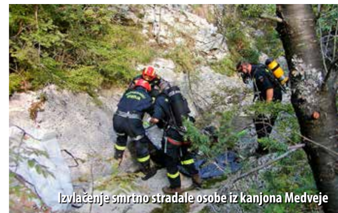
Izvlačenje smrtno stradale osobe iz kanjona Medveje

Raznolike su akcije traganja u kojima su dosad sudjelovali liburnijski vatrogasci. – Kada su u pitanju naši sugrađani, uglavnom se radi o starijim osobama narušenoga zdravlja