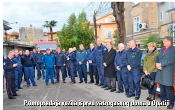
Primopredaja vozila ispred vatrogasnog doma u Opatiji

N ova godina za vatrogasce liburnijskoga područja počela je vrijednom donacijom. Sredinom siječnja u Opatiju su stigla tri nova vatrogasna vozila koja će znatno poboljšati operativnu učinkovitost liburnijskih vatrogasaca. Vozila su stajala 1,2 milijuna kuna, a sredstva su osigurali Grad Opatija te liburnijske općine: Matulji, Lovran i Mošćenička Draga.