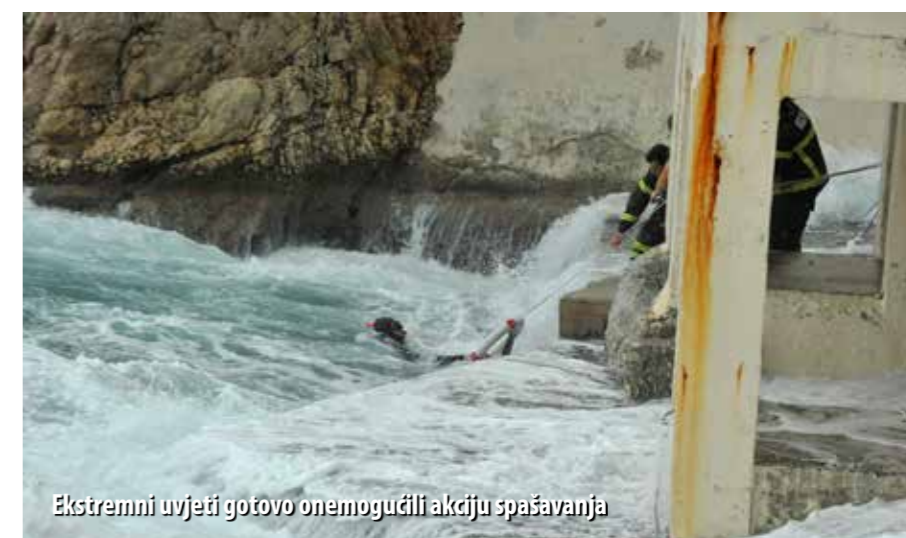
Ekstremni uvjeti gotovo onemogućili akciju spašavanja

lje do mora kako bih procijenio ozbiljnost situacije, dok su članovi mog tima iz vatrogasnog vozila donijeli ronilačku i drugu potrebnu opremu. Odmah je bilo jasno da su kupači preplašeni, potplađeni i iscrpljeni. Stajali su na uskom stjenovitom pojasu podno Ho-