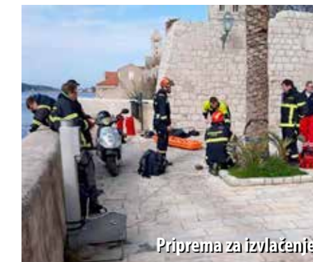
Priprema za izvlačenje

Unatoč svemu, loparski su vatrogasci s pet mlazova vode, obuhvatnom taktikom, započeli gašenje krovovišta, a istodobno je izvršeno vađenje plinskih boca i stavljanje objekta izvan napona. U međuvremenu su stigli i rapski vatrogasci koji su pristupili gašenju unutarnjom navalom. Probili su se do potkrovlja i nastavili gasiti požar krovovišta, pri čemu su salonitne ploče počele padati s krova. Požar je lokaliziran u 23.30 h, ali su vatrogasci preventivno ostali na požarištu još nekoliko sati.