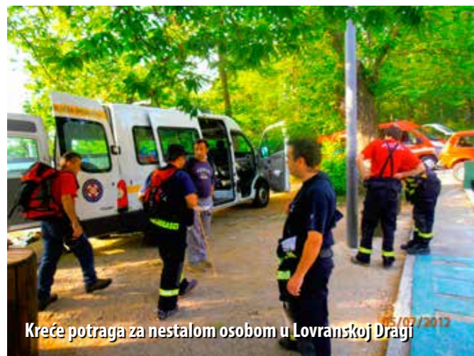
Kreće potraga za nestalom osobom u Lovranskoj Dragi