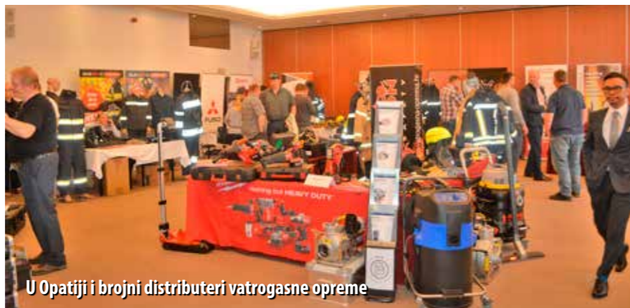
U Opatiji i brojni distributeri vatrogasne opreme

Ante Sanader, predsjednik HVZ-a, također je pozdravio okupljene, izrazivši uvjerenje da će predviđena stručna