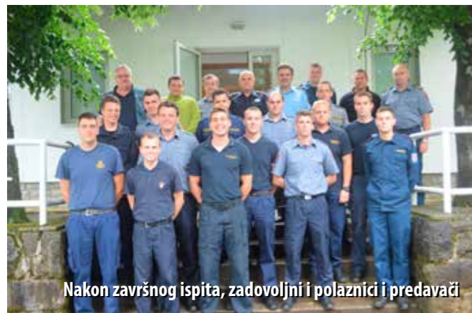
Nakon završnog ispita, zadovoljni i polaznici i predavači