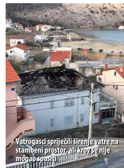
Vatrogasci spriječili širenje vatre na stambeni prostor, ali krov se nije mogao spasiti

Potpomognut jakom burom, požar se brzo proširio na cijelo krovovište, a zaprijetio je i susjednim kućama. Uz jaku buru, posao vatrogascima otežavala je i iznimno niska temperatura, uslijed čega je došlo do zaleđivanja vode koja se cijedila niz objekt i oko objekta te zaleđivanja dijelova osobne zaštitne opreme vatrogasaca, namočene uslijed gašenja.