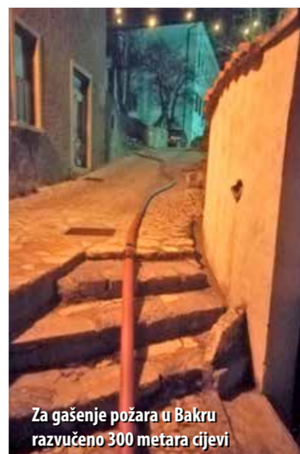
Za gašenje požara u Bakru razvučeno 300 metara cijevi

U jednom danu dogodila su se čak tri veća požara krovova, a vatrogasne će ekipe dugo pamtit i onaj u Bakru, prije svega zbog nemogućnosti pristupa vatrogasnim vozilima. Požar je, naime, izbio na kući u staroj jezgri Bakra pa su vatrogasci morali razvući čak 20 tlačnih cijevi, ukupne duljine 300 metara, kako bi došli do požarom zahvaćene kuće. – Cijevi smo razvlačili po uskim grad-