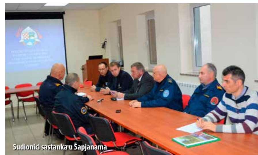
Sudionici sastanka u Šapjanama

Sudionici sastanka iskazali interes za daljnje zajedničke iskorake u Trenažnome centru Šapjane. Predloženo potpisivanje sporazuma o suradnji kojom bi Šapjane postale referentni centar za potrese.