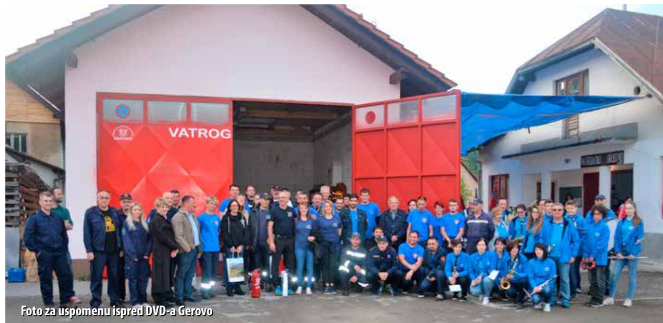
Foto za uspomenu ispred DVD-a Gerovo