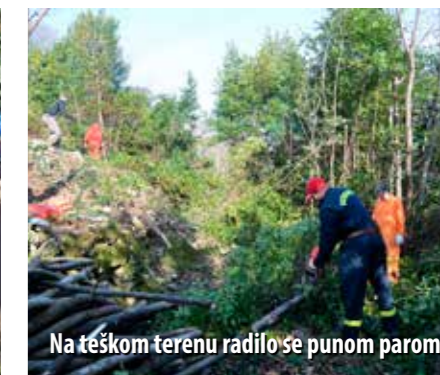
Na teškom terenu radilo se punom parom

Šezdesetak dobrovoljaca iskoristilo je jedan vikend sredinom veljače za hvalevrijednu akciju. Naime, čistili su 500-tinjak metara dugačak i 10 metara širok zaštitni pojas podno Mošćanica. U akciji su sudjelovali pripadnici Civilne zaštite Općine Mošćenička Draga, članovi Lovačkoga društva Perun, Udruge građana Mošćenica, lokalnoga DVD-a Sisol te ostali građani.