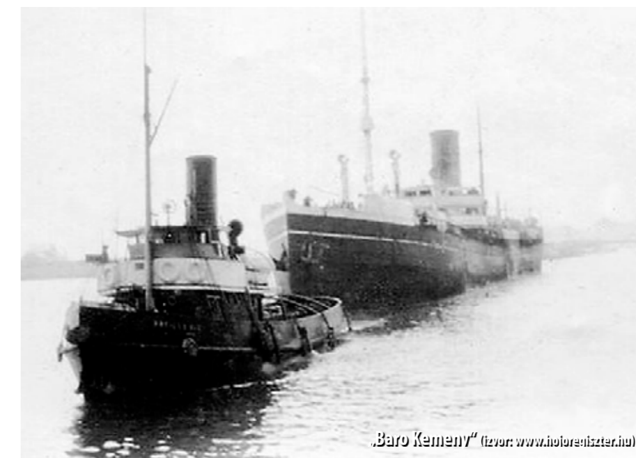
„Baro Kemeny“

Veliki požar na parobrodu „Baro Kemeny“ dogodio se u studenom 1918. godine, tijekom plovidbe od Boke kotorske do Splita. Uzrok požara i točan broj žrtava nikada nisu utvrđeni. Procijenjeno je da je stradalo više od 250 ljudi.