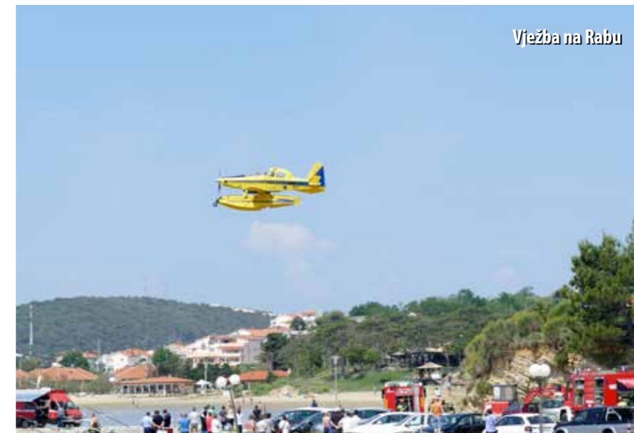
Vježba na Rabu

K ao i prethodnih godina, vatrogasne snage Primorsko-goranske županije požarnu će sezonu dočekati bez dislokacija vatrogasnih snaga iz unutrašnjosti, ali ojačane sa 60 sezonskih vatrogasaca. Najviše će ih biti angažirano na najzahtjevnijim područjima – u Novom Vinodolskom i Crikvenici, potom na Krku i na liburnijskom području te u ostalim priobalnim područjima. U odnosu na prošlu sezonu, vatrogasci će na raspolaganju imati dva vozila više, a riječ je o pickup vozilima, nabavljenim za potrebe liburnijskih vatrogasaca. Nabavljena je i jedna visokotlačna pumpa te 50-ak komada tlačnih cijevi koje će Vatrogasna zajednica podijeliti svojim DVD-ovima.