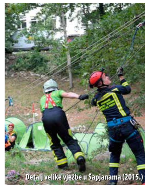
Detalj velike vježbe u Šapjanama (2015.)

Suočeni sa sve većim izazovima struke, vatrogasci se redovito pripremaju za sve vrste intervencija. – U JVP-u Opatija svakodnevno provodimo naše planove vježbe, u sklopu kojih je obuhvaćen i segment traganja i spašavanja. Vatrogasci se zapravo 365 dana u godini pripremaju za sve moguće intervencije, a obučeni smo i za pružanje prve pomoći. Imamo svu potrebnu opremu za to, pa i defibrilator, tako da možemo puno pomoći. Vježbe provode i u DVD-ovima, gdje također postoji kontinuitet obuke. Akcije traganja i spašavanja ubuduće će nam biti mnogo lakše. Naime, JVP Grada Rijeke uskoro će nabaviti dva drona s termo kamerama, koji će se u slučaju potrebe koristiti i za traganje, pojašnjava Filinić.