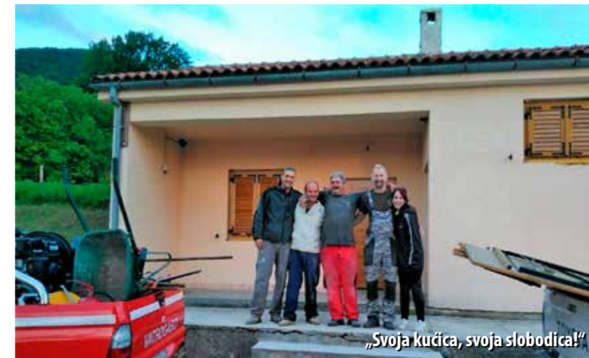
„Svoja kućica, svoja slobodica!“