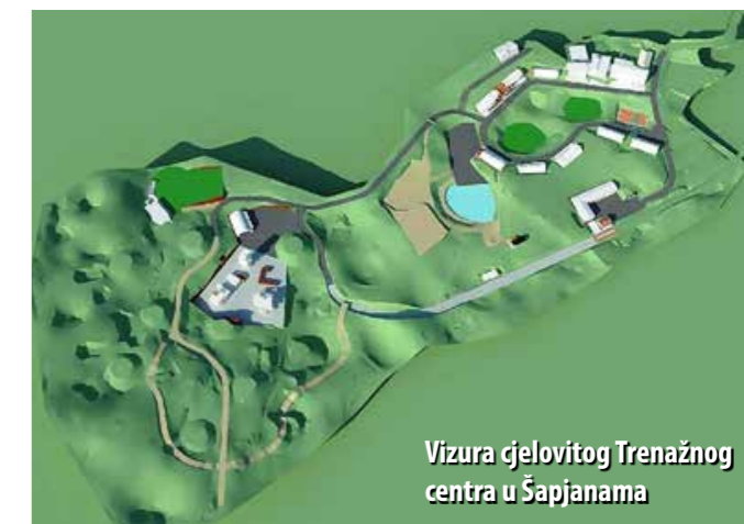
Vizura cjelovitog Trenažnog centra u Šapjanama