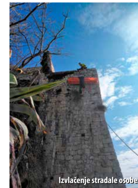
Izvlačenje stradale osobe