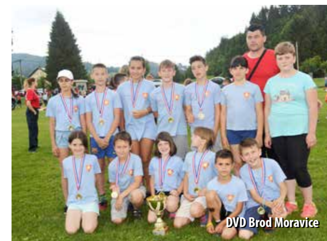
DVD Brod Moravice