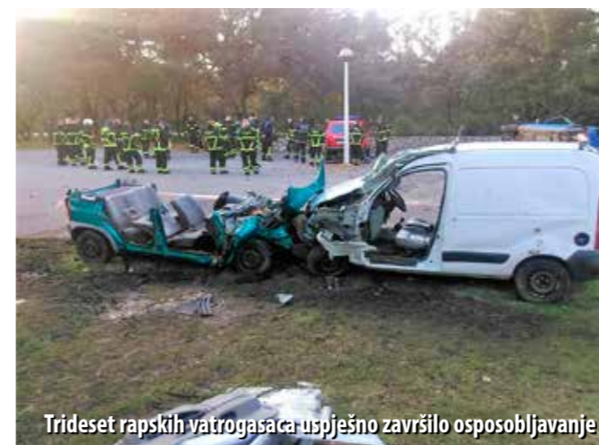
Trideset rapskih vatrogasaca uspješno završilo osposobljavanje