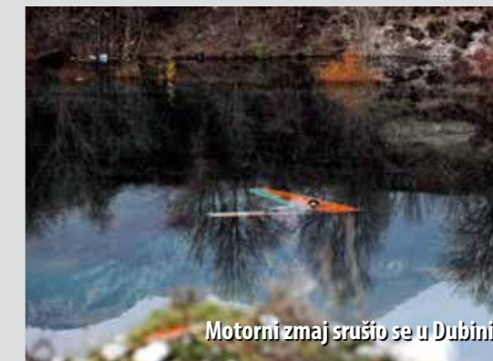
Motorni zmaj srušio se u Dubini

– Pri toj intervenciji glavni je problem bila hladna voda, a u opasnosti smo, pored pilota, bili samo kolega iz GSS-a i ja. Na Pećinama smo svi bili ugroženi, i mi u moru, ali i svi na obali. Pored toga, u trenutku dolaska na intervenciju, mi vatrogasci postali smo odgovorni za sve civile koji su se tamo našli i trebalo je mnogo umješnosti i napora da se svih dovede u sigurnu zonu, da se spriječi civile kako ne bi samoinicijativno pokušali spasiti svoje prijatelje i time dodatno zakomplicirati cijelu situaciju, a bili smo itekako svjesni da nas s vrha ceste promatra 100-ak građana te mnogobrojni novinari. U svom tom metežu trebalo je reagirati racionalno, brzo, profesionalno. Zaista, bilo je to vrlo stresno, kaže Škamo.