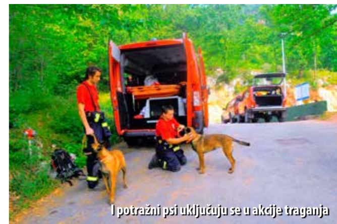
I potražni psi uključuju se u akcije traganja

Vatrogasci diljem Primorsko-goranske županije povremeno sudjeluju u akcijama traganja i spašavanja, pa tako i oni s područja Liburnije, koju izdvajamo kao tipičan primjer. Dogodi se da na liburnijskome području prođe cijela godina bez tog tipa intervencije, ali u prosjeku svake godine vatrogasci na tom području imaju 10-ak akcija traganja i spašavanja.