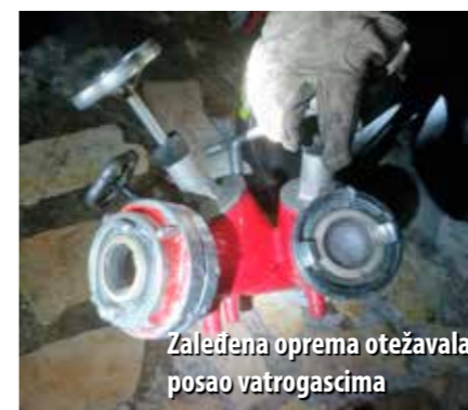
Zaleđena oprema otežavala posao vatrogascima

skim uličicama u kojima nam se općenito bilo jako teško orijentirati. Isto tako, nadzemni hidrant koji se nalazi u neposrednoj blizini objekta koji je bio ugrožen, nismo mogli otvoriti jer je postavljen uz sami zid druge kuće pa ga nismo mogli otvoriti ključem. Kad na to sve skupa nadovežete gluho doba noći, zaleđivanje vode u cijevima (sredstvo za gašenje), zaleđivanje površina po kojima smo se kretali, mogućnosti ozljeđivanja nas samih, a i svih civila iz susjednih kuća koje smo iz predostrožnosti probudili i izvukli van iz toplih kreveta, jasno je koliko je ta intervencija bila zahtjevnija, ističe Dino Škamo, voditelj smjene JVP-a Rijeka, postaje Vežica, koji je sa svojom ekipom gasio požar u Bakru. – Sve više i više smo svjedoci ekstremnog ponašanja prirode tijekom cijele godine. Na posljedice tog ekstremizma i dalje najbrže odgovara upravo naša struka. No, svima nam je potrebna promjena pristupa, kako bismo ubuduće još učinkovitije odgovarali na takve izazove, prokomentirao je Škamo.