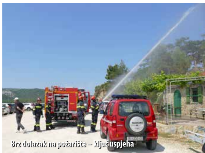
Brz dolazak na požarište – ključ uspjeha

- Za ovogodišnju vježbu odabrali smo otok Rab zato što je najudaljeniji otok u našoj županiji i problem je prijevoz vatrogasnih vozila s kopna na otok, pod uvjetom da vremenski uvjeti dopuštaju vožnje trajekta. Htjeli smo provjeriti realna vremena potrebna za dolazak na Rab, na ispomoć. Dolazili smo iz trajektne luke Valbiska na otoku Krku te preko Stinice, a u planu je bilo i prebacivanje snaga helikopterom, ali taj dio nismo uspjeli realizirati, tako da smo od zračne potpore imali samo airtractor . Za ovogodišnju vježbu iskoristili smo i Lučku kapetaniju koja je također sudjelovala sa svojim brodom u pomorskom desantu i prebacivala naše snage na otok, a zahvaljujući dolasku dviju cisterni iz JVP-ova Opatije i Rijeke mogli smo pratiti i realna vremena koja postrojbama trebaju za dolazak na mjesto požara. Međutim, na Rabu je, čak i u uvjetima kada su sve linije u prekidu, dobra situacija jer i DVD Rab i DVD Lopar imaju po 40 operativnih vatrogasaca, tako da imaju dobre kapacitete za samostalno djelovanje. Rab je odabran i zbog provjere funkcioniranja digitalne radio veze, koju smo počeli uvoditi na priobalju, a bila je to prilika i za provjeru mogućnosti našeg zapovjednog vozila. Vježbom smo htjeli provjeriti djelovanje vatrogasnih postrojbi pri složenom požaru otvorenog prostora, njihovo združeno djelovanje, kao i način zapovijedanja u takvim si-