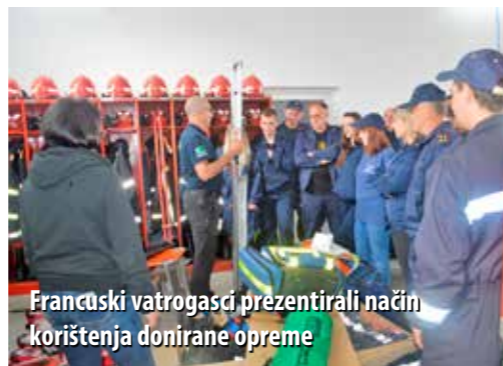
Francuski vatrogasci prezentirali način korištenja donirane opreme