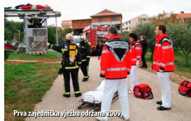
Prva zajednička vježba održana 2009.