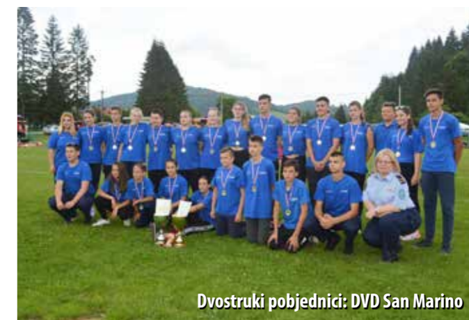
Dvostruki pobjednici: DVD San Marino