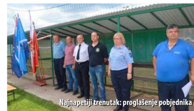
Najnapetiji trenutak: proglašenje pobjednika