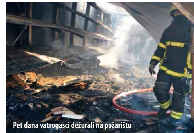
Pet dana vatrogasci dežurali na požarištu

Očevidom je utvrđeno da je požar prouzročio ljudskom nepažnjom. Naime, kako otkriva snimka videonadzora, radnik Elgrada ispraznio je pepeljaru s opušcima u plastičnu vrećicu za smeće i nešto prije 21.00 h napustio skladište, po završetku smjene. Kanta sa smećem se potom zapalila, a požar se brzo proširio. Neoprezni radnik tereti se za teško kazneno djelo protiv opće sigurnosti, za što mu prijete zatvorska kazna u trajanju od šest mjeseci do pet godina.