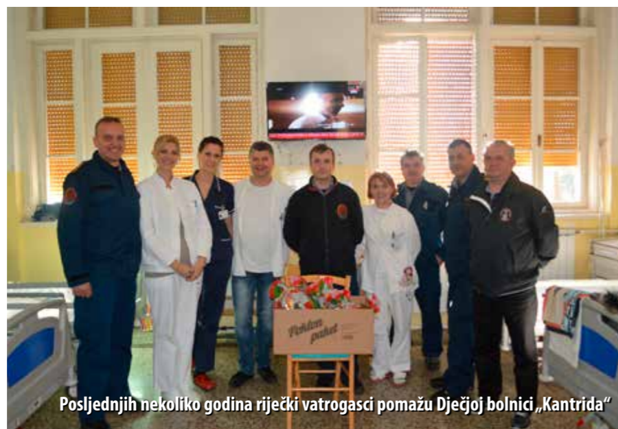
Posljednjih nekoliko godina riječki vatrogasci pomažu Dječjoj bolnici „Kantrida“

Lani je na tom natjecanju od kotizacija te donacija samih natjecatelja, ali i raznih pravnih osoba, prikupljeno čak 18.500 kn. Većim dijelom tog novca nabavljena je oprema za Dječju bolnicu „Kantrida“, točnije Odjel za fizikalnu i rehabilitacijsku medicinu. Tako su, zahvaljujući tom humanom činu, mali riječki pacijenti dobili zidna ogledala u sobama za vježbanje, elektrostimulator te strunjače, platforme i lopte za vježbu. JVP Rijeka sjetio se i svojih socijalno ugroženih sugrađana pa je dio novca izdvojen i za donaciju hrane riječkoj Socijalnoj samoposluzi „Kruh sv. Ane“, čije su korisnike obradovali u veljači ove godine.