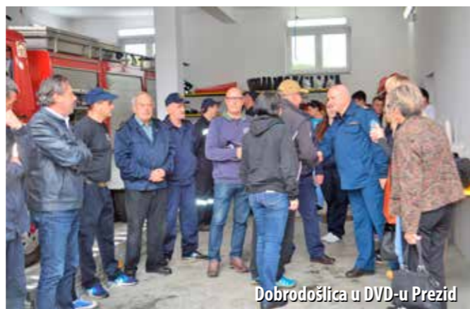
Dobrodošljica u DVD-u Prezid