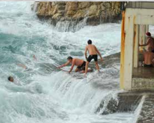
Spašavanje na Pećinama