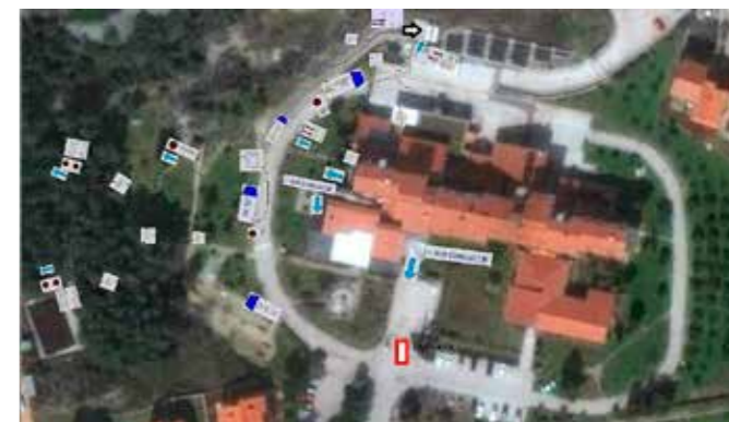
Raspored snaga tijekom vježbe