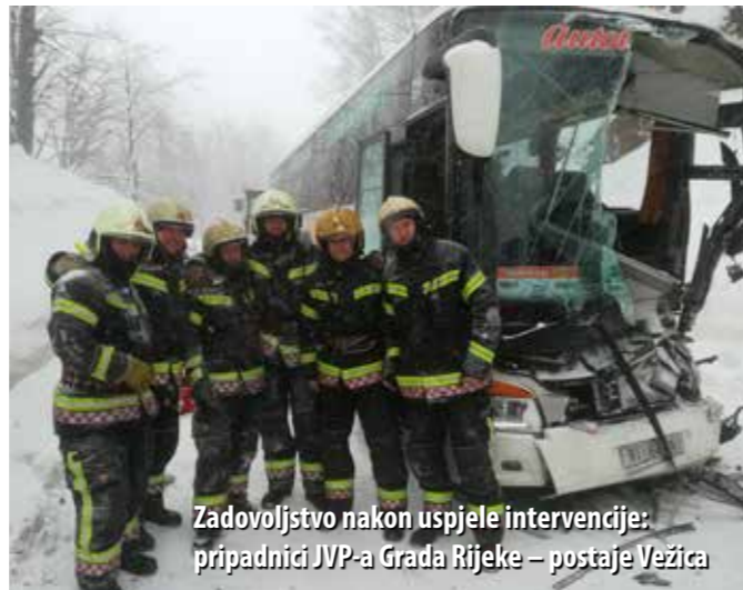
Zadovoljstvo nakon uspjele intervencije: pripadnici JVP-a Grada Rijeke – postaje Vežica

Goleme količine snijega koje su u veljači okovale Gorski Kotar, izazvale su pojačanu aktivnost vatrogasaca koji su pomagali u uklanjanju snijega s najkritičnijih lokacija, posebno s krovova. Većinu posla odradile su lokalne vatrogasne snage, ali je goranskim vatrogascima u dva navrata ipak stigla ispodručje iz priobalja. Tako su dobrovoljci iz DVD-ova Opatija i Kras-Šapjane pomagali u čišćenju krovova u Ravnoj Gori, a riječki profesionalci u Lokvama. U dva je navrata zasjedao i županijski Stožer civilne zaštite, na kojem su se dogovarali detalji o daljnjem postupanju i što učinkovitijem saniranju posljedica ekstremnih snježnih padalina.