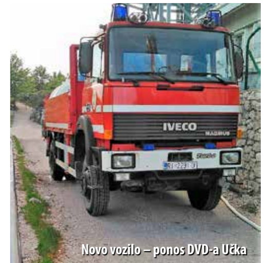
Novo vozilo – ponos DVD-a Učka

K ada se u srpnju prošle godine slavila 10. obljetnica DVD-a Učka, njegov predsjednik Santo Pulić izdvojio je dvije velike želje koje to društvo ima: novo vatrogasno vozilo te pronalaženje odgovarajućeg prostora za rad Društva i smještaj opreme.