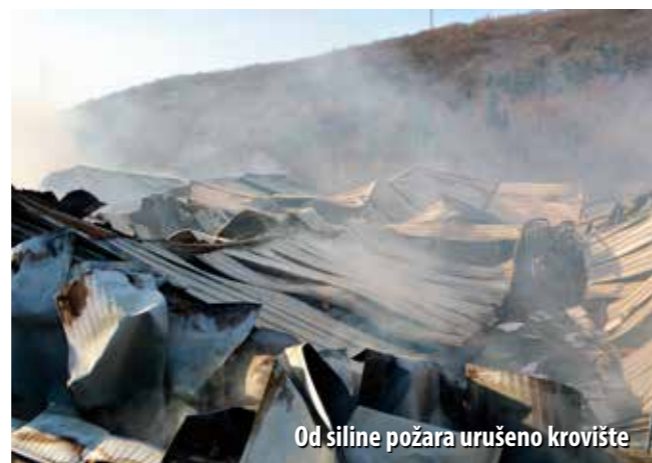
Od siline požara urušeno krovništvo