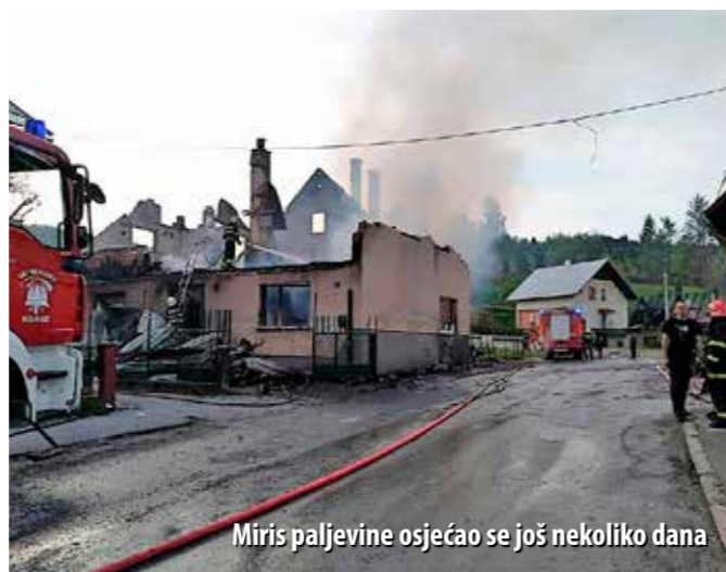
Miris paljevine osjećao se još nekoliko dana

Ono što je najviše zaprepastilo sve mještane, ali i same vatrogasce, bila je upravo brzina širenja vatre. - Dojavu o požaru DVD Gerovo zaprimio je u 14.15 h i mi smo odmah krenuli na intervenciju. Mislili smo da se radi o požaru samo jedne kuće, no, kad smo došli, vidjeli smo da je vatra već zahvatila nekoliko objekata. Prizor je bio strašan. S ovom našom jadnom tehnikom borili smo se koliko smo mogli. Imali smo problema i s neispravnim hidrantima. Odmah smo zatražili pomoć dodatnih snaga, s kojima smo cijelo popodne i noć proveli na požarištu. Uspjeli smo napraviti pravo malo čudo jer smo spriječili daljnje širenje požara, što je ravno podvigu, budući da je plamen letio s krova na krov. Takva brzina širenja požara iznenadila je i naše kolege profesionalce iz Delnica, izjavio je Josip Rašperić, predsjednik DVD-a Gerovo, nakon cjelonoćne intervencije.