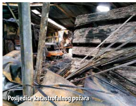
Posljedice katastrofalnog požara