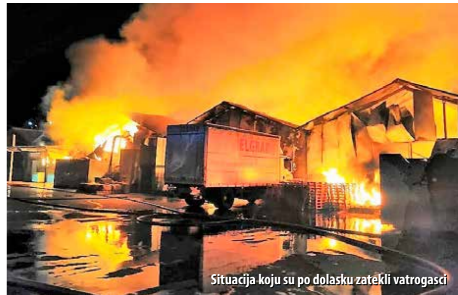
Situacija koju su po dolasku zatekli vatrogasci

U požaru kakav se u Rijeci ne pamti, u potpunosti je uništeno pet poslovnih hala. Gotovo šest dana trajao je angažman vatrogasaca, kojih je u tom razdoblju na požarištu bilo ukupno 80, s 20-ak vatrogasnih vozila. Požar je izazvao neoprezni radnik tvrtke Elgrad, a šteta je procijenjena na 7,5 milijuna kuna.