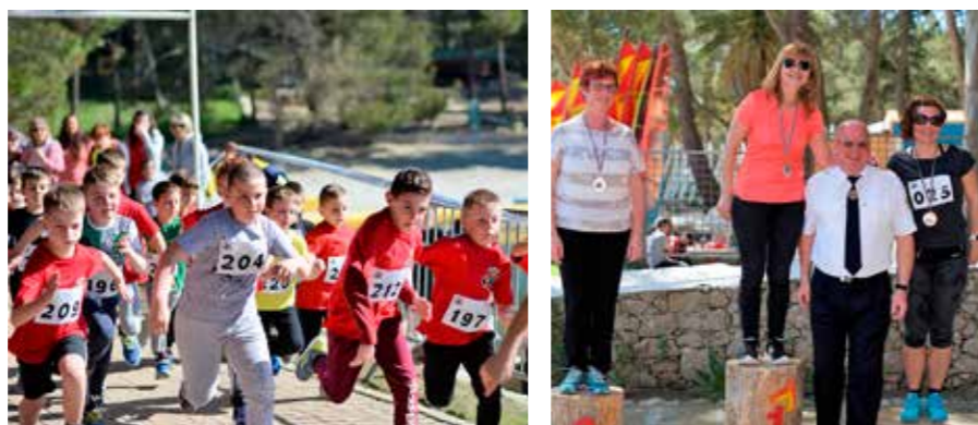
Utrka prošla u izvrsnom raspoloženju

Početkom travnja u Malom Lošnju je, pod pokroviteljstvom Grada Malog Lošinja, HVZ-a, VZPGŽ-a i TZ-a Mali Lošinj, održana 8. Međunarodna utrka vatrogasaca. Utrku je organizirao AK Lošinj, a sudjelovalo je 38 vatrogasnih postrojbi iz Italije, Slovenije i Hrvatske.