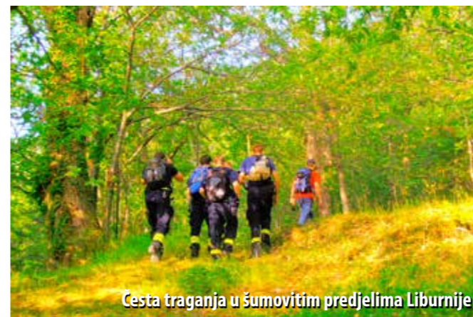
Česta traganja u šumovitim predjelima Liburnije