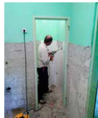
Uređenje u punom jeku

Učcarskim vatrogascima ostvarila se i druga želja. Naime, u ožujku ove godine nabavili su i višenamjensko vozilo za dostavu i opskrbu vodom, prijevoz materijala, dizanje tereta do 7,5 tona, čišćenje snijega i sl. Novo vozilo i opremu s kojom raspolažu s ponosom su predstavili u travnju, u povodu pučke fešte Markove, a za mnogobrojne mještane i njihove goste priredili su i pokaznu vježbu.