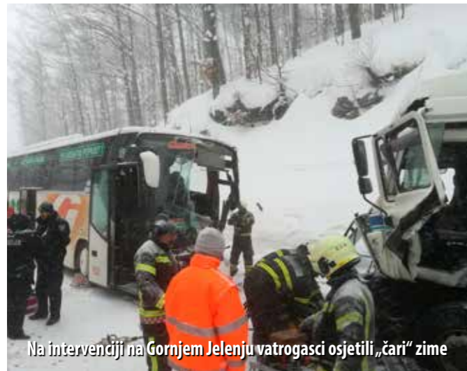
Na intervenciji na Gornjem Jelenju vatrogasci osjetili „čari“ zime

Ekstremni vremenski uvjeti koji su u veljači zahvatili cijelu Hrvatsku, pa tako i Primorsko-goransku županiju, izazvali su pojačanu aktivnost vatrogasnih postrojbi diljem županije. Najkritičnije je bilo od 22. do 28. veljače, kada su, samo u priobalnom dijelu županije, vatrogasne snage imale čak 88 intervencija.