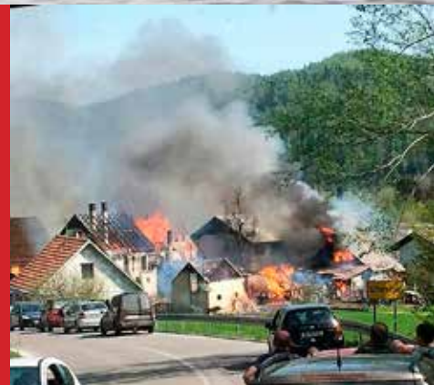
Požar u Smrečju