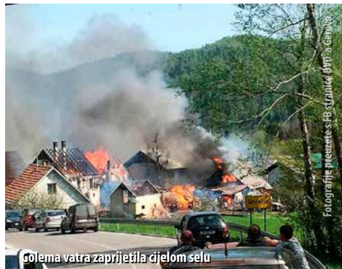
Golema vatra zaprijetila cijelom selu

U katastrofalnom požaru u Smrečju, nedaleko od Gerova, izgorjele su četiri kuće i dvije štale. Nadljudskim naporima vatrogasci uspjeli zaustaviti vatrenu stihiju. Šteta golema.