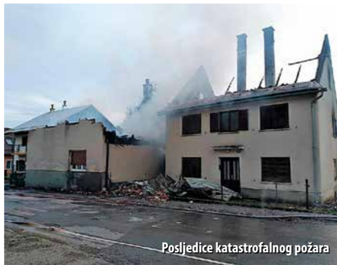
Posljedice katastrofalnog požara

Potkraj travnja gorjelo je i u Gorskome kotaru, u mjestu Smrečje, u kojem živi svega 30-ak ljudi, a mnoge su kuće stalno prazne ili njihovi vlasnici u njih vraćaju tek povremeno.