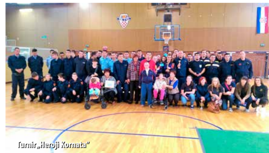
Turnir „Heroji Kornata“

- S obje ustanove surađujemo već dugi niz godina. Svake godine tijekom svibnja, mjeseca zaštite od požara, šticećenici oba doma posjete nas u našem vatrogasnom domu kako bi razgledali našu tehniku i upoznali se s našim radom. I mi njih posjećujemo, obavezno tijekom božićnih blagdana, kada oni imaju svoje priredbe. Tim se susretima podjednako vesele i šticećenici i mi. Oni se raduju našem dolasku, vole razgledavati naša vozila, a nas beskrajno vesele njihovi iskreni osmjesi i sreća na licima. Također, kad god je to potrebno, mi s našim kombijem prevozimo šticećenike oba doma, najčešće u Rijeku, kada oni odlaze na razne predstave ili u svoj Centar na Brašćinama i sl., kaže Kružić.