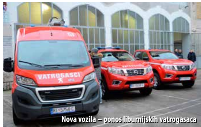
Nova vozila – ponos liburnijskih vatrogasaca

Vozila za JVP Opatija, DVD Opatija i DVD Kras-Šapjane, vrijedna 1,2 milijuna kuna, financirana su sredstvima liburnijskih jedinica lokalne samouprave, a 70-ak tisuća kuna za njihovo opremanje osigurat će PVZ Liburnije.