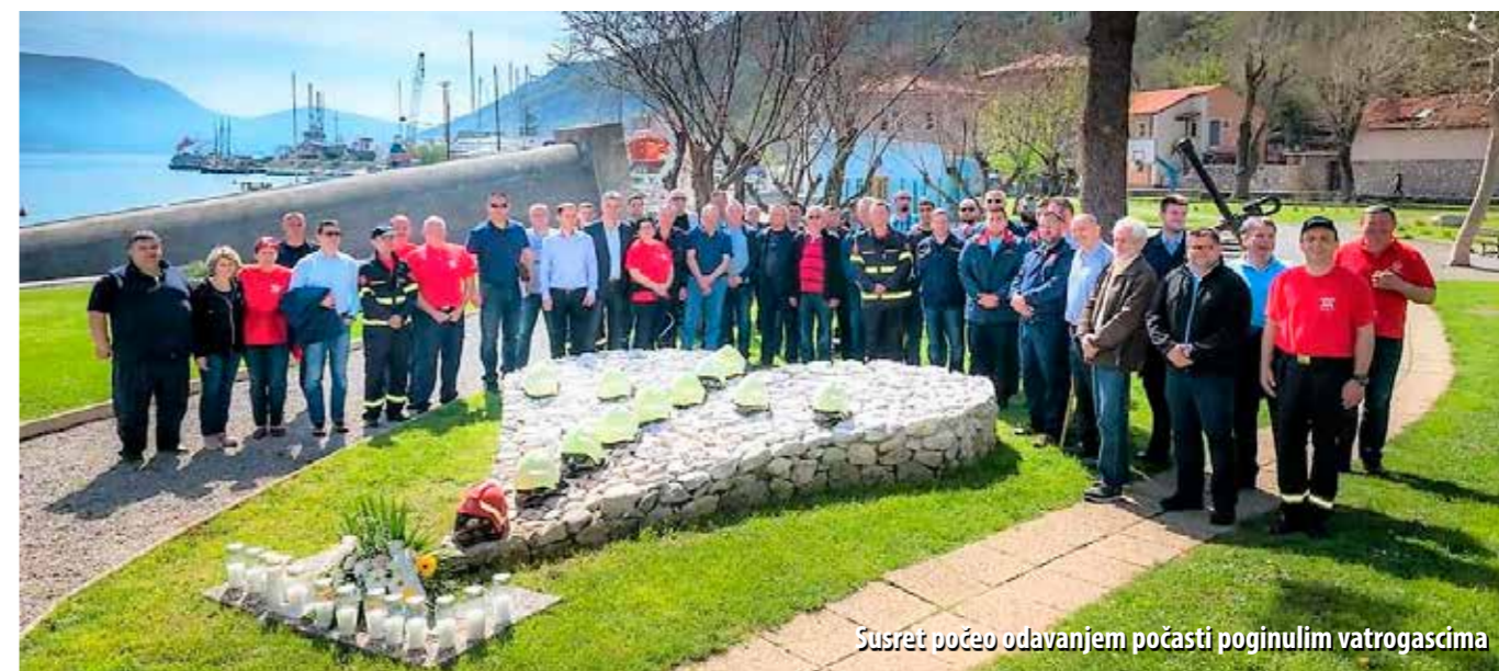
Susret počeo odavanjem počasti poginulim vatrogascima

Sredinom travnja u Bakru je održan susret Koordinacije plavo-zelene linije prijateljstva. Ovo je 21. godina prijateljstva i suradnje dobrovoljnih vatrogasnih društava priobalja i kontinenta, a Koordinaciju sačinjavaju DVD Kutjevo, DVD Lobar, DVD Slatina, DVD Velika, DVD Vodice, DVD San Marino Novi Vinodolski i VZ Grada Bakra.