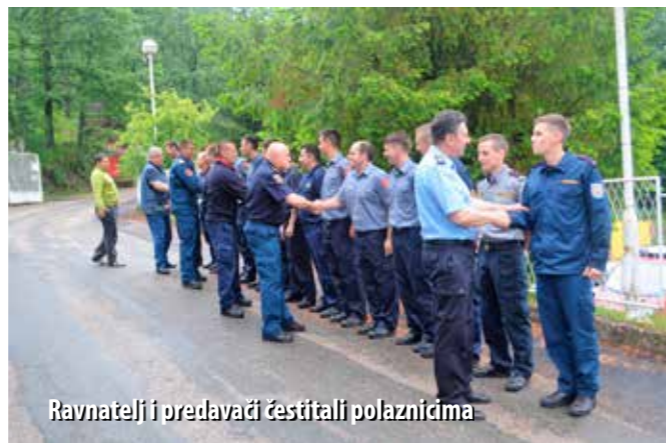
Ravnatelj i predavači čestitali polaznicima

Za polaznike riječke Vatrogasne škole, u Obučnom centru u Šapjanama potkraj svibnja održan je prvi ispitni rok, kojemu je pristupilo 14 od ukupno 27 polaznika Škole. Svi su kandidati s uspjehom obranili svoj završni red i stekli zvanje vatrogasca, odnosno vatrogasnog tehničara.