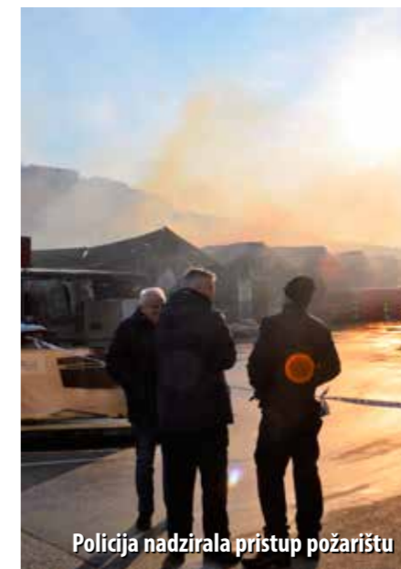
Policija nadzirala pristup požarištu

Vatra se vrlo brzo proširila na pet od ukupno sedam skladišnih hala u nizu, a snažan požar zaprijetio je i automobilima na parkiralištu ispred hala te susjednim zgradama u toj poslovnoj zoni. O intenzitetu požara govori i podatak da se i par dana nakon njegovoga izbijanja, iznad skladišnih prostora Elgrada još se dizao gusti dim.