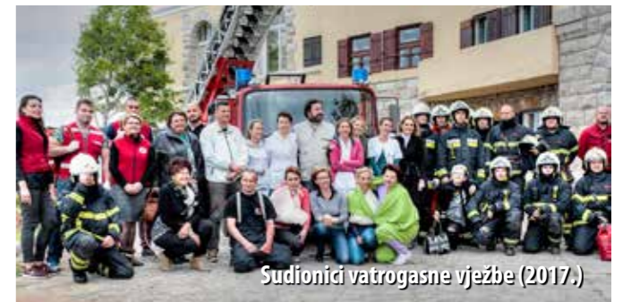
Sudionici vatrogasne vježbe (2017.)