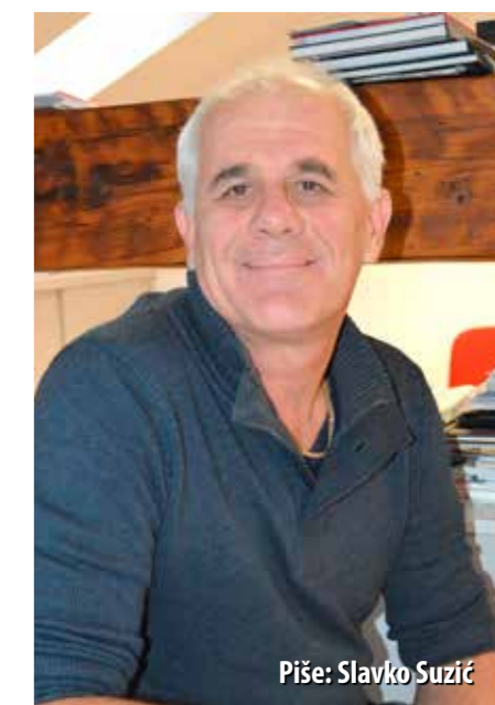
Piše: Slavko Suzić

Nakon poraza na balkanskom bojištu, a potom i na talijanskom, Austro-Ugarska je prestala postojati.