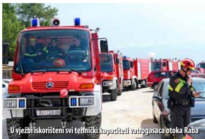
U vježbi iskoristeni svi tehnički kapaciteti vatrogasaca otoka Raba

tuacijama. Također je to bila prilika za uvježbavanje organizacije rada, koordinacije i pregrupiranja vatrogasnih snaga, primjenu različitih taktičkih pristupa te provjeru dijela opreme i tehnike, napominje Ščulac.