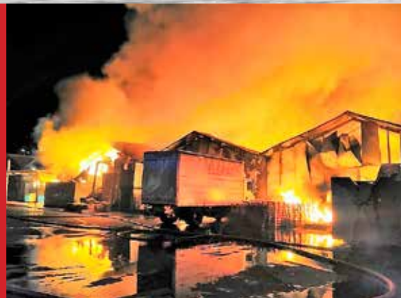
Požar na Škurinjama