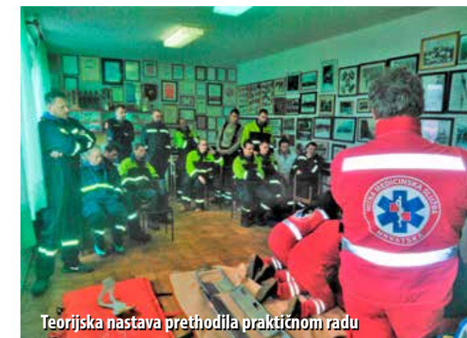
Teorijska nastava prethodila praktičnom radu

Područna vatrogasna zajednica otoka Raba provela je usavršavanje pripadnika vatrogasnih postrojbi DVD-a Rab i DVD-a Lopar za spašavanje pri tehničkim intervencijama. Obuka je realizirana u suradnji VZPGŽ-om i Zavodom za hitnu medicinu Primorsko-goranske županije – Ispostava Rab.