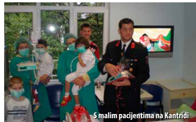
S malim pacijentima na Kantridi

Povezanost DVD-a Kraljevica s invalidnim osobama traje već desetljećima, što nije slučajno. Naime, na području Grada Kraljevice, među ostalim, djeluje i Centar za rehabilitaciju „Fortica“ te Dom za djecu i mladež „Oštro“. Te ustanove trenutno skrbe o 70-ak šticećenika, s tim da su u „Fortici“ djeca i odrasle osobe s najtežim oblicima fizičke invalidnosti i mentalne retardacije, dok u Domu „Oštro“ borave djeca s lakšim mentalnim ili tjelesnim oštećenjima.