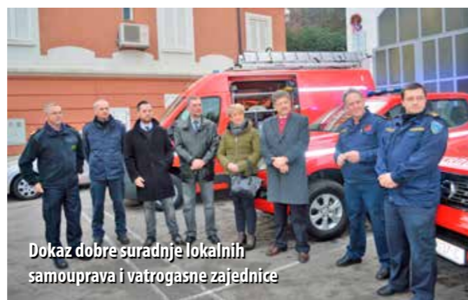
Dokaz dobre suradnje lokalnih samouprava i vatrogasne zajednice

Od 2012. godine u Primorsko-goranskoj županiji broj tehničkih intervencija veći je od onih požarnih. Porast broja tehničkih intervencija opći je trend u Hrvatskoj i svijetu. - U posljednjih pet godina, zbog ekstremnih vremenskih prilika, povećan je broj požara otvorenoga prostora, a povećale su se i tehničke intervencije na otvorenom prostoru. S ova tri vozila liburnijski vatrogasci mnogo će se lakše probijati kroz uske uličice Opatije, Lovrana i drugih mjesta, što će ubrzati dolazak vatrogasnih postrojbi na mjesto intervencije, a time i povećati našu učinkovitost. Nabavom ova tri vozila završen je i petogodišnji ciklus obnavljanja radio veza liburnijskoga područja, sva naša vozila prešla su na digitalni signal, što