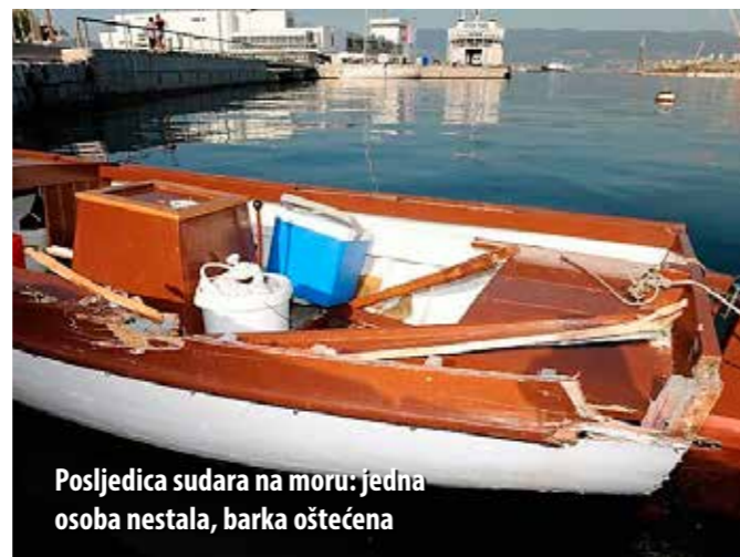
Posljedica sudara na moru: jedna osoba nestala, barka oštećena

koji izađu iz kuće ili staračkog doma i izgube se. Tako smo jednom tragali za staricom koja je pronađena drugi dan u dosta lošem stanju, ali živa. Sjećam se i potrage za jednom psihički nestabilnom osobom koja je nestala iz Opatije, a nakon pet dana pronađena je u kanjonu Medveje. Pronašao ju je slučajni šetač, nažalost mrtvu. Na jednu Staru godinu tragali smo pak za osobom koja je napustila starački dom u Ičićima, a pronađena je u Matuljima, kamo je došla autobusom. Sjećam se i čovjeka koji je nestao iz kuće u Iki, a pronašli smo ga u centru Lovrana. Pao je preko zida i smrtno stradao. Prije mnogo godina tragali smo i za jednim poljskim turistom. On je išao u šetnju kanjonom Medveje, prema Učki. Nakon pet dana potrage, pronađen je mrtav. Imali smo i „morska“ traganja. Prije nekoliko godina u Preluku je došlo do sudara barke i glisera, pri čemu je jedna osoba nestala u moru. Unatoč opsežnoj potrazi u koju su bili uključeni opatijski i riječki ronionci, tragali smo i našim gu-